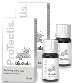
BioGaia® ProTectis® picături pentru copii