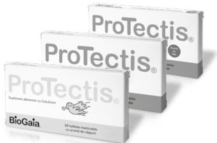
BioGaia® ProTectis® tablete masticabile cu aromă de căpșuni / lămâie / măr