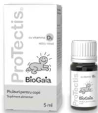
BioGaia® ProTectis® cu vitamina D 3 , picături pentru copii