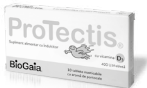
BioGaia® ProTectis® cu vitamina D 3 , tablete masticabile cu aromă de portocale

Nu adăugați în băuturi sau alimente fierbinți pentru a nu afecta culturile vii de lactobacili. BioGaia ProTectis picături pentru copii nu schimbă gustul băuturilor sau alimentelor cu care sunt amestecate.